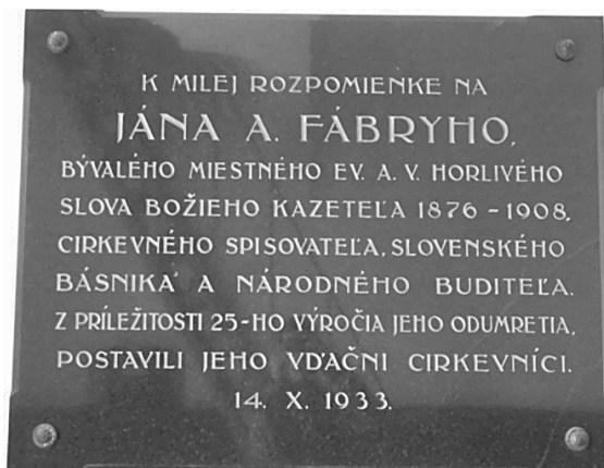
Pamätná tabuľa v evanjelickom kostole