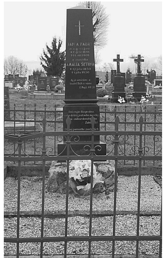
Hrob na cintoríne