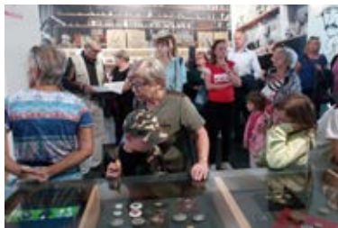
ZO SZPB vo Zvolenskej Slatine