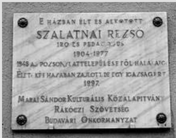
Pamätná tabuľa v Budapešti