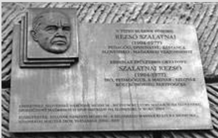
Pamätná tabuľa v Bratislave